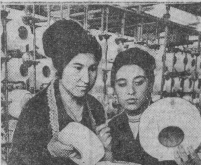
«Малика» трикотаж фирмасининг коллективни «Кўпроқ ва сифатлироқ нег истеъмол товарлари ишлаб чиқарайлик!» шiori остида меҳнат қилмоқда.

Республика Маҳаллий саноат министрлиги қарашли корхоналардан Илчи номидаги тажриба-механика заводида дастгоҳлар ишчи органларининг савтламлиги учун ишлатиладиган жинҳозларча буюртма келган эди. Корхонанинг ташаббускор-комсомоллари 17 минг сўмлик бу буюртмани ишдан кейинги соатларда тайёрлаб беришга қарор қилишди.