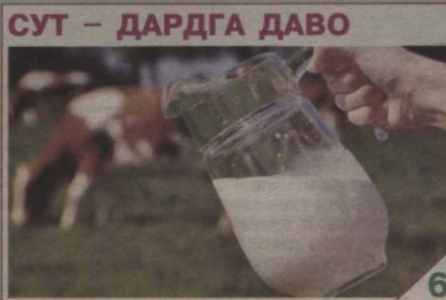
СУТ – ДАРДГА ДАВО