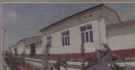
БУНЁДҚОРЛИК КЎЛАМИ КЕНГАЙМОҚДА