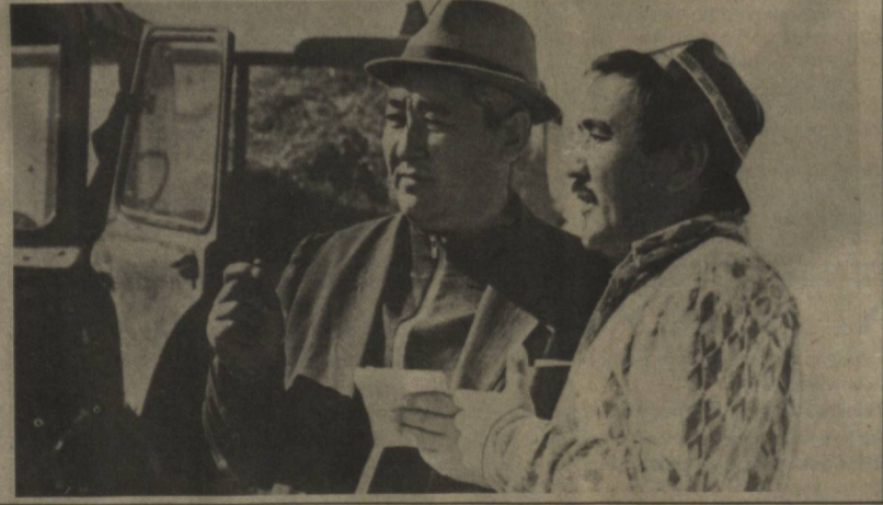
Халқимиз «киш гамини ёзда е», деб жуда топиб айтган. Чунки элимиз дастурхони тўкин, рўзгорларимиз бут, ҳаётимиз фарвон бўлишини дилгига жой айлаган чорвадорлар озукани кўпайтиришга алоҳида эътибор берадилар, яъни халқимизнинг юқоридаги табири билан айтганда, киш гамини ёзда кўриб кўйишади.

Деҳқончиликда ҳосилдорликни жадал оширишга тусқинлик қиладиган сабаблардан бири мелиорация жиҳатидан нобоб ерларнинг мавжудлигидир. Илмий тадқиқотларнинг курсатинчи, кучис шурланган ерларда ҳосил 20—25, уртача шурланганда 35—40, кучли шурланганда 80 фоз камаяди.