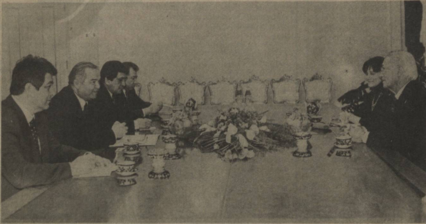
СУРАТДА: қабул пайти.

Мамлакатимиз раҳбари Ўзбекистон билан Франция уртасидаги муносабатлар, жумладан, иқтисодий ва маданий соҳадаги ҳамкорлик тобора ривожланиб бораётгани, Франциянинг куплаб машҳур фирма ва компаниялари республикамизда самарали фаолият кўрсатаётганини қайд этиб, узаро манфаатли алоқаларни янада равиқлаштириш борасида ҳали талай имкониятлар мавжудлигини