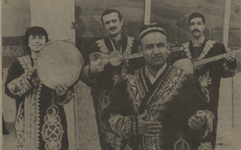
Когон тумани ҳокимлиги маданият бўлими қошидаги «Гузал» хаёқ ашула ва рақс дастаси қатнашчилари ҳам «Ўзбекистон — Ватанам меним» кўрак-танловинида фаол иштирок этмоқда.