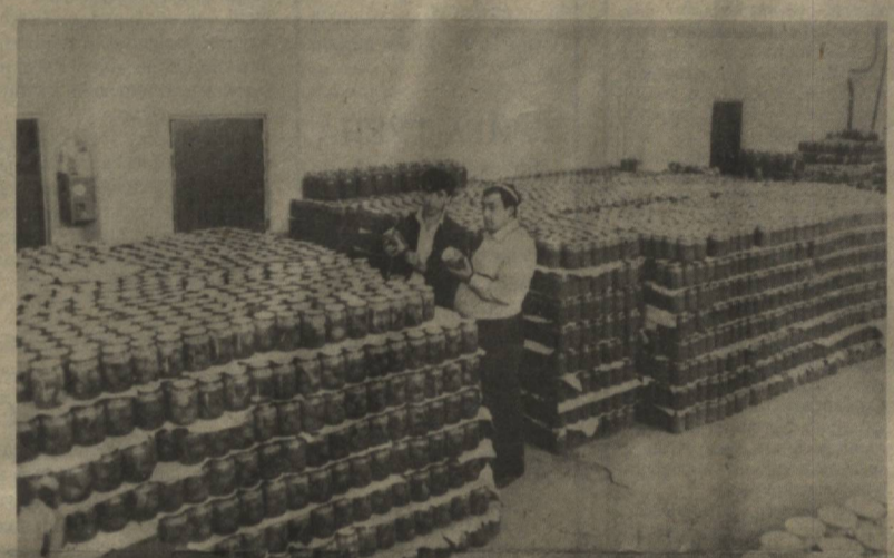
Бағдод туманидаги Охунбобоев номли жамоа хўжалигида иқтисодиётни юксалтиришга қаратилган аниқ тадбирлар амалга оширилмапти. Хусусан йилга 3 миллион шартли банка консервалар ишлаб чиқарадиган цех ишга тушганига қўп бўлгани йўқ. Бу ерда тайёрланаётган сифатли неъматларга (суратда) харидор сероб.

Ер юзида тинчликни мустаҳкамлаш ишга муносиб ҳисса қўшаётган Ўзбекистон Президентини Ислам Каримовнинг Туркменистонга январь ойида қилган сафари шу маънода муҳим аҳамият касб этди. Мазкур таширфга катта умид боғлаган халқларимизнинг орзулари ижобат булди. Икки мамлакат уртасида турли соҳаларда ҳамкорлик қилиш юзасидан 21 та ҳужжат имзоланди. Бу яхшиликка, эзгуликка, тинчликни мустаҳкамлашга хизмат қилади. Ватан ишқи қалбимизда жўш ураверсин! Орзулари ушалган эл — Ўзбекистон гуллаб яшнасин!