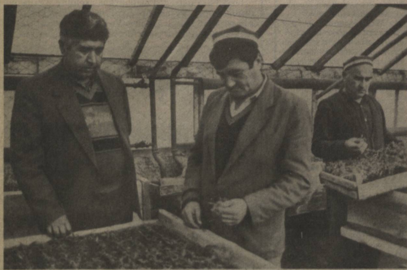
Зангиота туманидаги «Навруз» жамоа хужалиги аъзолари иқтисодий ислохотларни ҳаётга татбиқ эта бориб, эл дастурхонини ноз-неъматлар билан туддиришда астойдил меҳнат қилишмоқда. Айни пайтда хужалик тасарруфидаги иссиқхоналарда етиштирилган помидор, бодринг, карам кучатлари далаларга кўчириб ўтказилаяпти.