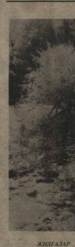
ЖИЛГАЛАР ТУТАШГАН ЖОЙДА

Кинотеатрлар ҳусусийлаштирилди Бухоро вилоятида кинотеатрлар ҳусусийлаштирилади бошланди. Ҳозирдак Пешку туманида иккита, Ёғилуван туманида битта кинотеатр эгасини топди.