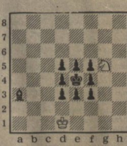
Соҳибқирон жанг тафсилотлари — унга юришчи туғри топган шахмат муҳлислари исми шарифларини газетамиз саҳифаларида эълон қиламиз.

Энди ушбу масалани эътиборингизга ҳавола қиламиз. Дастлабки вазият қуйидагича: Бу вазиятга қоралар шохчи