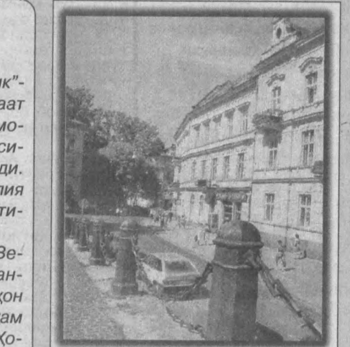
УКРАИНА. Львов шаҳри қўришишдан лавҳа.

ТОКИО. АҚШ маъмурияти «еттилик»-ка азё давлатлар ҳукуматига мурожаат қилиб, Шарқий Осиё минтақасидаги молиявий инқирозни бартараф этиш юзасидан кенгаш ўтказиш таклифини билдирди. Унда ривожланган «етти» мамлакат молия вазирлари ҳамда банк раҳбарлари иштирок этиши кўзда тутилган.