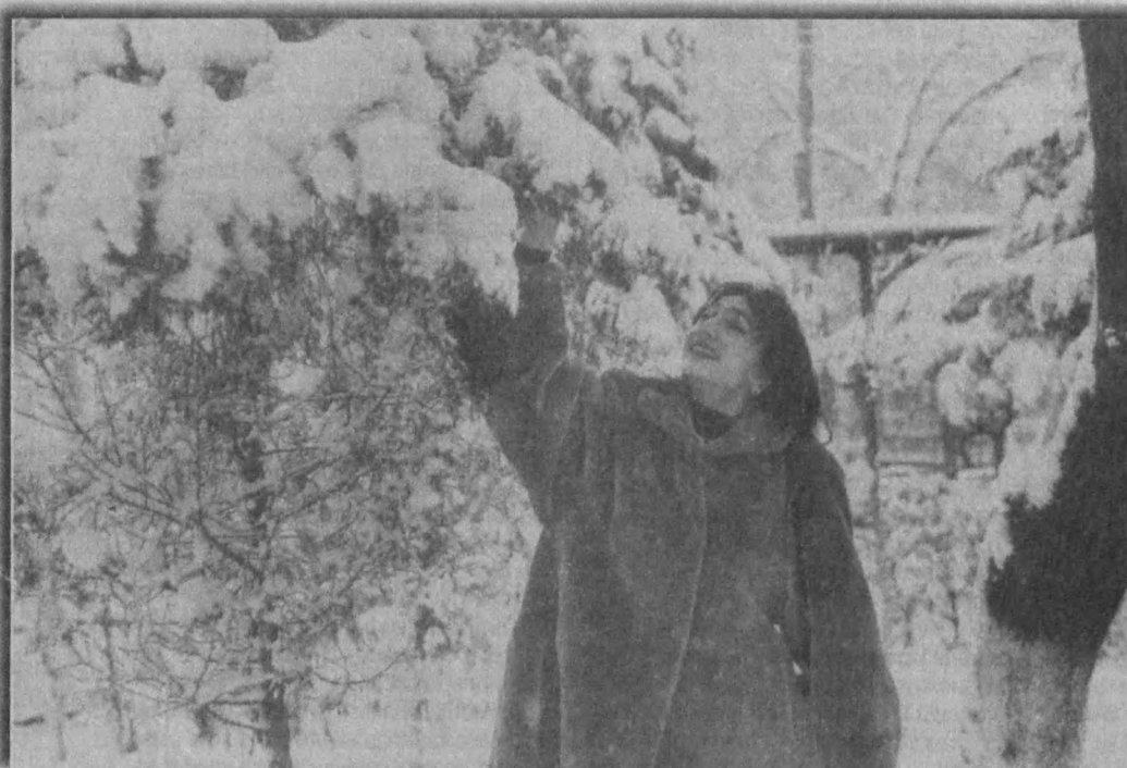
«Шу гўзал деб ёққанмиди қор?»