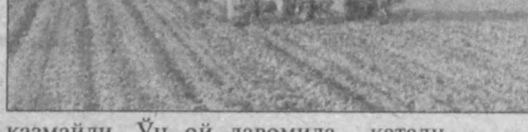
қишлоқларини мактаб, боғча болаларига текинга тарқатади.

қозмайди. Ўн ой давомида унинг томорқасидаги тупроқ худди элакдан ўтказилгандек майин ва унумдор бўлади.