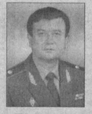
Шундай. Аввало, оиладаги тарбия соғ-саломат бўлишга, тинчлик-тотувилик, бир-бирини тушуниш ҳўкм сурса, солиҳ ва солиҳа фарзандлар ота-она уғитларини доимо ёлда сақласалар, имон-этиҳод тушунарларини онгига сингирган одамларнинг оиласидаги хотиржамлик доимий равишда давом этади.

Оиласини қадраган одам Ватанини ҳўйма қилишга қодир, деган фикрни қандай изҳорлайсиз?