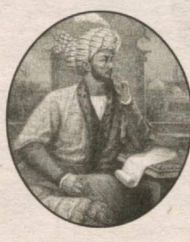
Bobur Mirzo o'n ikki yoshida davlatni bosh-qargan.