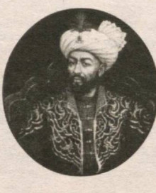
Mirzo Ulug'bek to'rt yoshida sovg'a sifatida usturlub asbobini tanlab, Amir Temurdek ulug' bobosini qoyil qoldirgan.