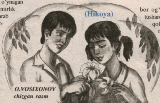
O.VOSIXONOV chizgan rasm

Kamolning oilaviy sharoiti og'ir bo'lgani bois, tushdan keyin ishlardi. Dadasi tez-tez kasalxonada davolanar, bu paytda oilaning