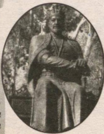
Amir Temur to'q-qiz yoshida shahrisabzlik allomalarining nazariga tushgan.

Xalqimizda: «Bo'lar bola boshidan», degan naql bor. Bu behuda emas. Bo'ladi-gan bola yoshligidan o'z yo'lini topib oladi va shuning uchun ham ularning nomi tarix zaravarlari abadiy muhratlanadi.