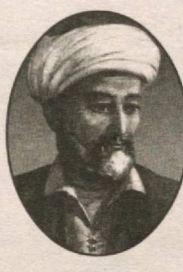
Alisher Navoiy to'rt-besh yoshida Fariddiddin Attorning «Mantiq ut-tayr» («Qush tili») asarini to'liq yod olgan.