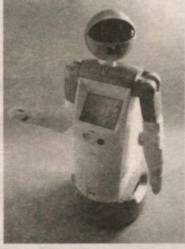
Internet xabarlarini asosida GULYUZ tayyorladi

Bo'yi 81 santimetr, og'irligi 14 kilogrammni tashkil qilgan robot shlemiga 14 ta mikrofon o'rnatilgan. Robot mikrofonlar yordamida inson tomonidan buyurilgan ishlarni bajaradi. Dumaloq g'ildiraklari yordamida soatiga 6 kilometr masofani bosa oladigan ushbu temirtan uyni ham qo'riqlay oladi.