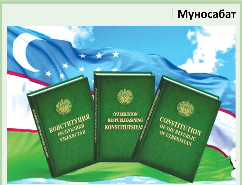
Ўзбекистон Республикаси Конституциясини замон талабларига мос тарзда ўзгартириш зуруратдир.

ёхуд мутолаа ишончини мустақамлаган ҳужжат