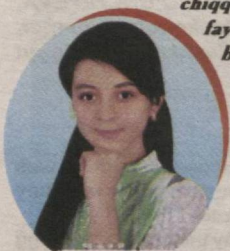
TENGI YO'Q GULIM

Respublikamizning turli go'shalaridan oppoq kabutar yanglig' qanot yozib kelayotgan dilnomalardan bahor nafasi ufuradi. Bepoyon qirlar bag'rida o'zlarining burgutcha varraklarini uchirayotgan bolalarning quvnoq qiyqirig'i purviqor tog'larni uyg'otib yuborgandek bo'ladi. Ha, bahor yer-u osmonga jon ato etadigan nurafshon fasl. Qaldirg'ochlar ayvonimizga charx urib chiqqanidan bilamizki, ular xonadonimizga rizq-u ro'z, fayz-u barokat ato etishadi. Olam yam-yashil libosiga burkanganda, unga mahliyo bo'lmagan yurak yo'q. Bu yog'i bahor, gulzorlar ko'ngilga ko'chadi. Borliqqa mahliyo bo'lib yashash zavqi qalbingizni sira tark etmasin.