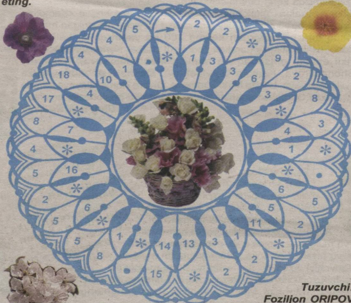
Tuzuvchi: Foziljon ORIPOV

Endi kalit so'zlari javoblari orqali shakldagi muammonomani hal eting.