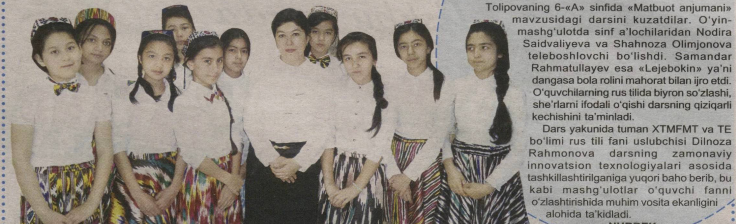
ZUBAYDA olgan suraitlar