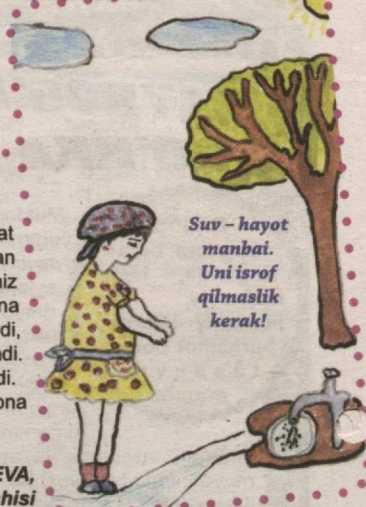
Suv – hayot manbai. Uni isrof qilmaslik kerak!