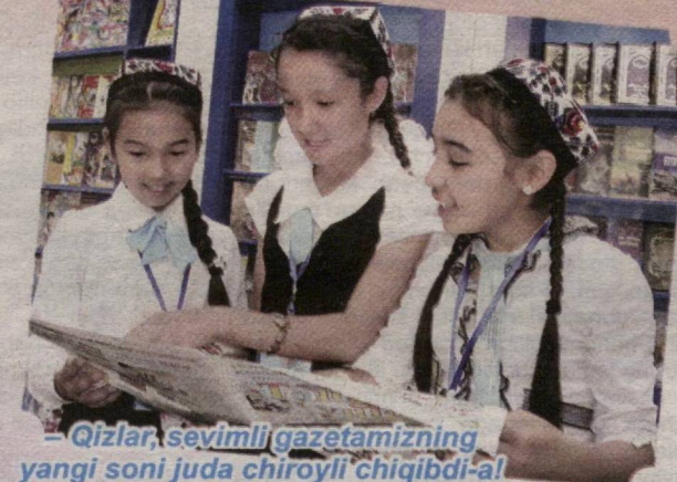
– Qizlar, sevimli gazetamizning yangi soni juda chiroyli chiqibdi-al!