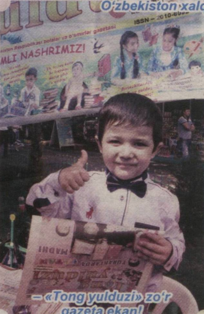
– «Tong yulduzi» zo'r gazeta ekan!