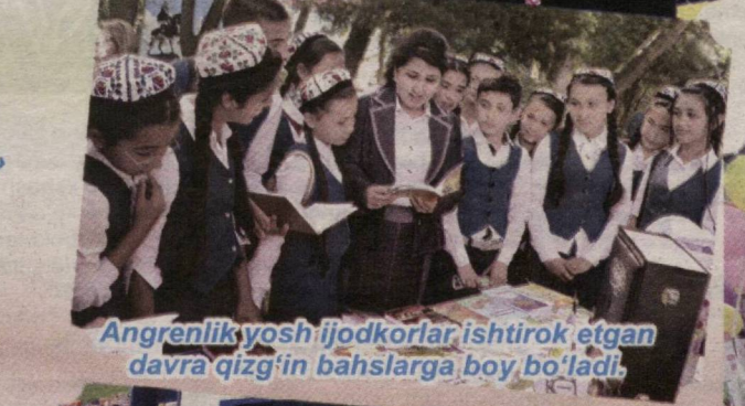
Angrenlik yosh ijodkorlar ishtirok etgan davra qizg'in bahslarga boy bo'ladi.