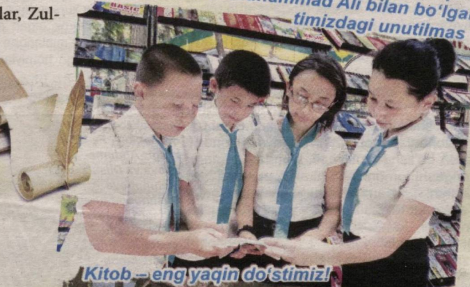
Kitob – eng yaqin do'stimiz!