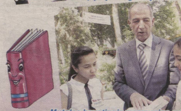
– Mutolaa hayotingiz mazmuniga aylansin, – deydi O'zbekiston xalq shoiri Sirojiddin Sayyid.