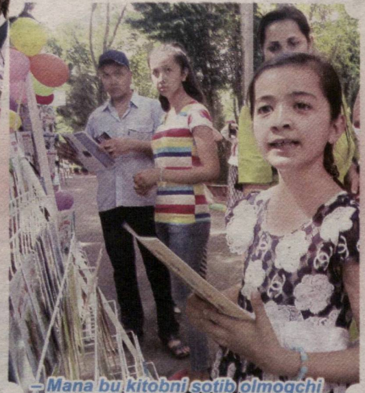
– Mana bu kitobni sotib olmoqchi edim, narxi ham arzon ekan.