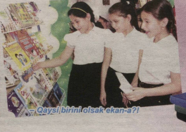
– Qaysi birini olsak ekan-a?!