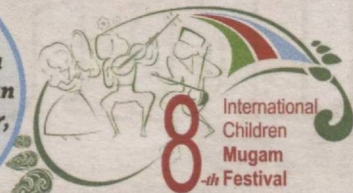
8-ci Beynolxalq Ushaq Mugam Festivali

Go'zal va hamisha navqiron Marg'ilon shahri haqida so'z ketganda har kim unga o'zgacha ta'rif beradi. Kimdir bu ko'hna kentni atlas-u adraslari bilan butun dunyoni maftun aylagan shahar, desa, yana kimdir allomalarga beshik bo'lgan yurt, deya e'zozlaydi.