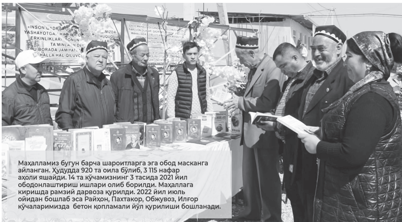
Маҳалламиз бугун барча шароитларга эга обод масканга айланган. Худудда 920 та оила бўлиб, 3 115 нафар аҳоли яшайди. 14 та кўчамизнинг 3 тасида 2021 йил ободонлаштириш ишлари олиб борилди. Маҳаллага киришда рамзий дарвоза қурилди. 2022 йил июль ойидан бошлаб эса Райхон, Пахтакор, Обжувоз, Илғор кўчаларимизда бетон қопламали йўл қурилиши бошланади.