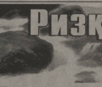
Сувнинг ҳар бир томчиси сув. Агар сув қадри, унинг тириклик, ризқ-рўз манбаи эканлигининг мазмун-моҳиятиға етсак, ана шу томчида, сув заррасида ҳам барҳаётлик маъжудлигини англаб етамиз.

рожаат қилган бўлса, уларнинг аксарияти доимий иш билан таъминланди. 31 нафари ҳақ тўланадиган жамоат ишлариға жалб қилинди, 167 нафариға тегишли маслаҳат ва йўл-йўриқлар кўрсатилди.