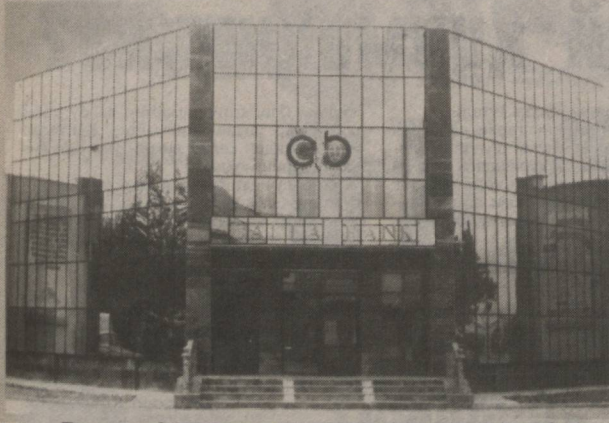
Бозор инфратузилмасининг муҳим бўғинларидан бири ҳисобланган банк тизими мамлакат иқтисодиётининг ривожланишида ўзига хос ўрин тутади. Ҳукуматимиз томонидан ўтказилаётган иқтисодий ислохотларда тижорат банкларининг фаол иштироки иқтисодий ўзгаришларнинг янада самарали бўлишига ижобий таъсир кўрсатмоқда.

Мамлакатимизнинг йирик ва барқарор ривожланаётган молиявий ташкилотларидан бири - Республика акциядорлик тижорат банки "Фаллабанк" бошқа молиявий муассасалар қатори иқтисодиётда, айниқса, қишлоқ ҳўжалиги соҳасида амалга оширилаётган тўб ўзгаришларда фаол иштирок этиб келмоқда.