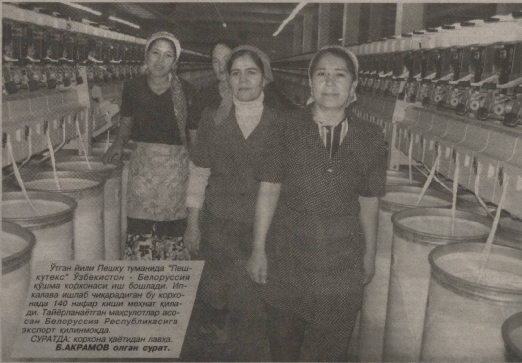
Ўтган йили Пешку туманида "Пешкутукс" Ўзбекистон - Белоруссия қўшма корхонаси иш бошлади. Ип-калава ишлаб чиқарадиган бу корхонада 140 нафар киши меҳнат қилади.

Шимолӣй Кореяда деярли ногирон одамлар учрамайдди. Чунки бу давлатда нуқсон билан туғилган чақалоқлар ўлдириб юборилди.