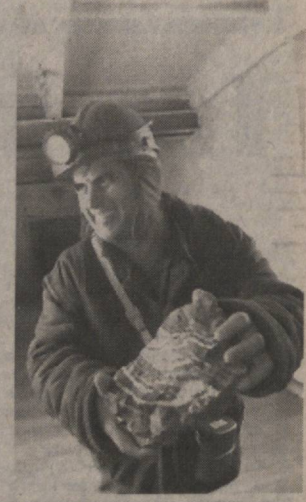
Мурунтов, Чорметан, Қўкплатос, Бешқудук, Қорақўтон ва бошқа олтин конлари ана шулар жумласидандир.

Ҳаёт ҳақиқатининг ўзи - тўғри, ҳалол яшаш дегандир, яна бир томони ўзининг эмас, халқининг, Ватанингни қандай хизмат қилганига барибир бир кун келиб тарозига қўйилар экан. Икки пал-