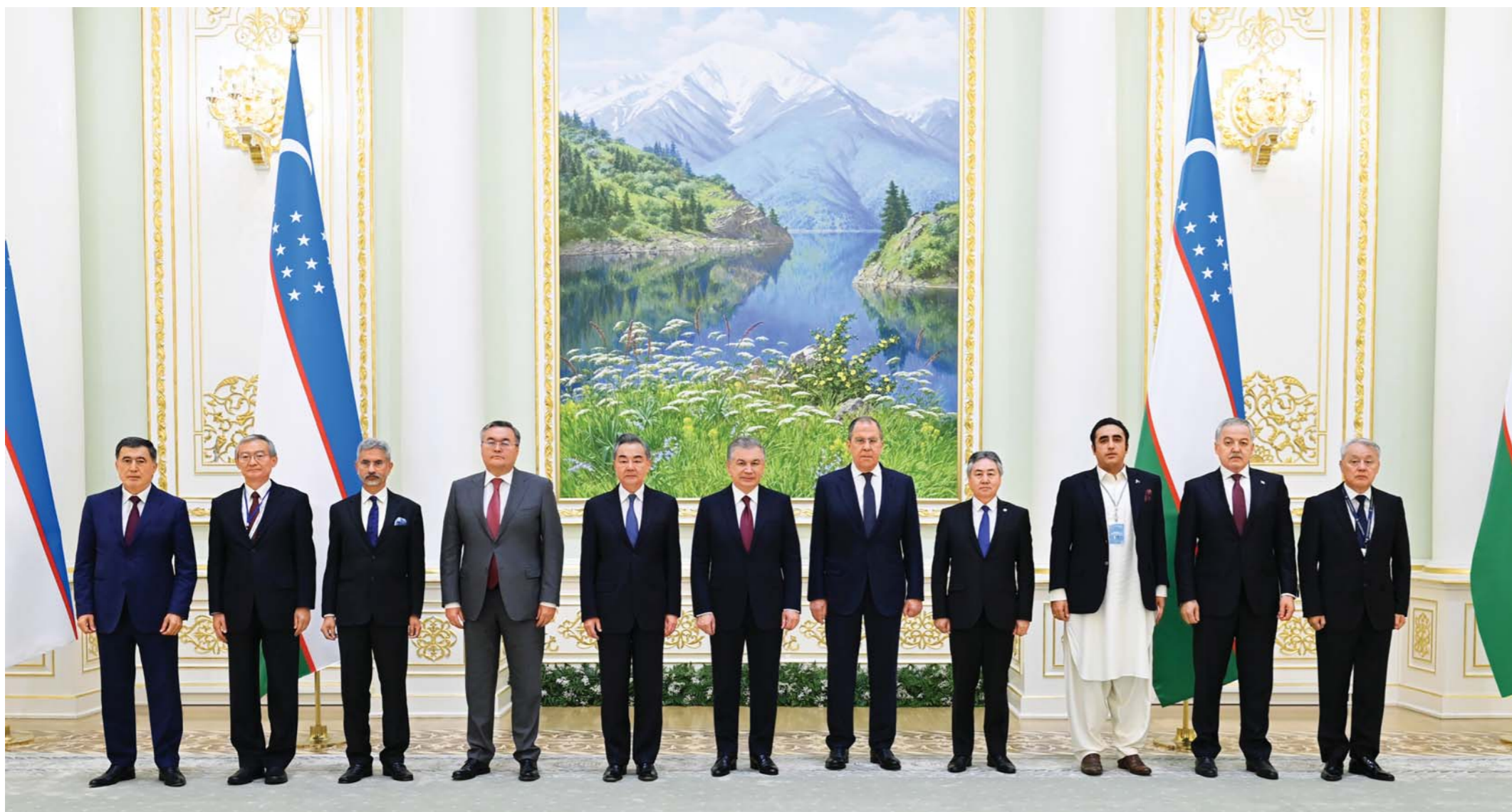
Президенти Ҷумҳурии Ӯзбекистон Шавкат Мирзиёев 29 июл сарони ҳайати давлатҳои узви Созмони ҳамкории Шанхайро, ки дар ҷарабаниҳои ҷамъномаи Шӯрои Вазирони қорҳои хориҷии кишварҳои СҲШ дар пойтахтамон иштирок мекунанд, қабул кард.

Дар воҳури вазири қорҳои хориҷии Ҷумҳурии Ҳиндустон Субраманиам Чайшанкар, муовини Сарвазир – вазири қорҳои хориҷии Ҷумҳурии Қазоқистон Мухтар Тлеуберди, узви Шӯрои давлатӣ, вазири қорҳои хориҷии Ҷумҳурии Мардумии Чин Ван И, вазири қорҳои хориҷии Ҷумҳурии Қирғизистон Жээнбек Кулубаев, вазири қорҳои хориҷии Ҷумҳурии Ислонии Покистон Билавал Бхутто Зардорӣ, вазири қорҳои хориҷии Федератсияи Русия Сергей Лавров, вазири қорҳои хориҷии Ҷумҳурии Тоҷикистон Сирочиддин Мухриддин, инчунин котиби генералии Созмон Ҷан Мин ва директори Кумитаи иҷроияи Сохтори минтақавии зиддтеррористи СҲШ Руслан Мирзаев иштирок карданд.