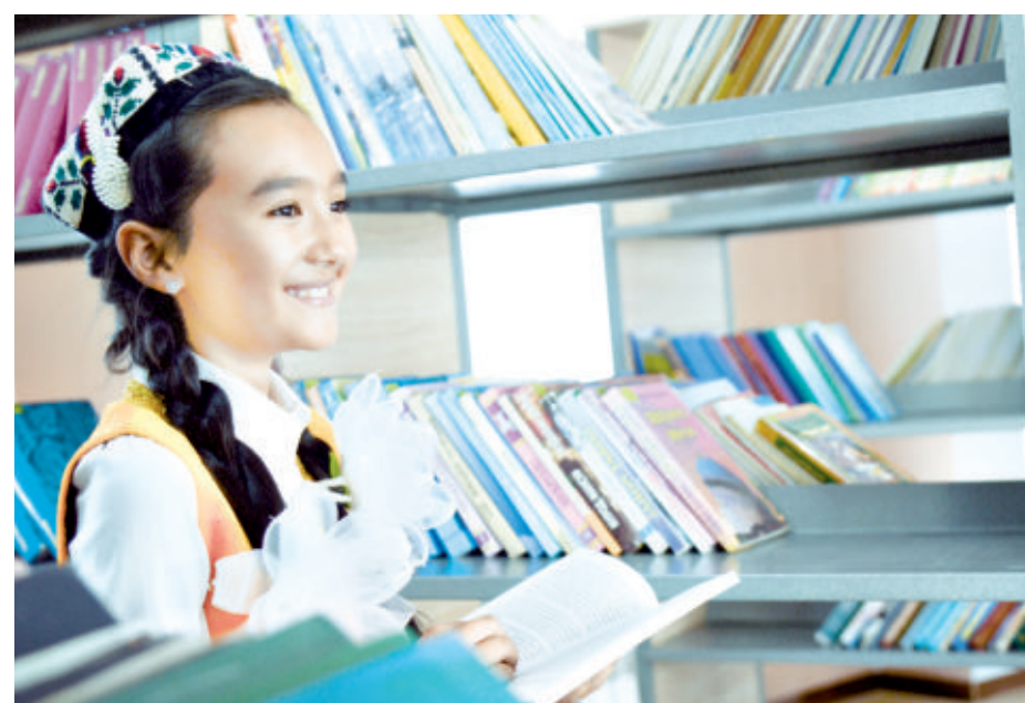
▶ Давоми 6-бетда

билан танишамиз. Бу мўъжизами? Албатта, мўъжиза! Аллоҳ таоло инсонга ато этган улуг, бебаҳо неъмат — тафаккур маҳсули булар. Китобнинг фазилатлари, қудрати хусусида теранроқ ўйлаганимиз сари унинг янги-янги қирралари намоён бўлаверади. Унга ошно бўлиб, уни яхши кўриб қолганимизни ўзимиз ҳам билмай қоламиз. Бунинг натижасида ўша оддий варақлар қатига одамларни кўрамиз, уларнинг ўзаро суҳбатларини эшитамиз, қадди-қомати, кийиниши кўз ўнгимизда намоён бўлади. Шу аснода ўша одамлардан қайси бирига ҳавас қиламиз, қайси биридан нафратланамиз, қай бири билан дўстлашиб, бировини севиб қоламиз.