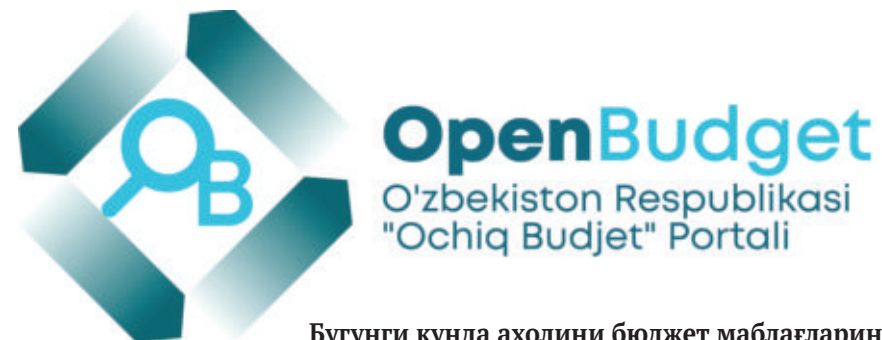
▶ Давоми 2-бетда

Бугунги кунда аҳолини бюджет маблағларини тақсимлаш жараёнига жалб этиш орқали фуқаролик жамияти ҳаётида улар иштирокини фаоллаштиришга жиддий эътибор қаратилмоқда. Бу эса жамоатчилик назоратини жорий этиш асносида бюджет маблағларидан самарали фойдаланишда қўл келяпти.