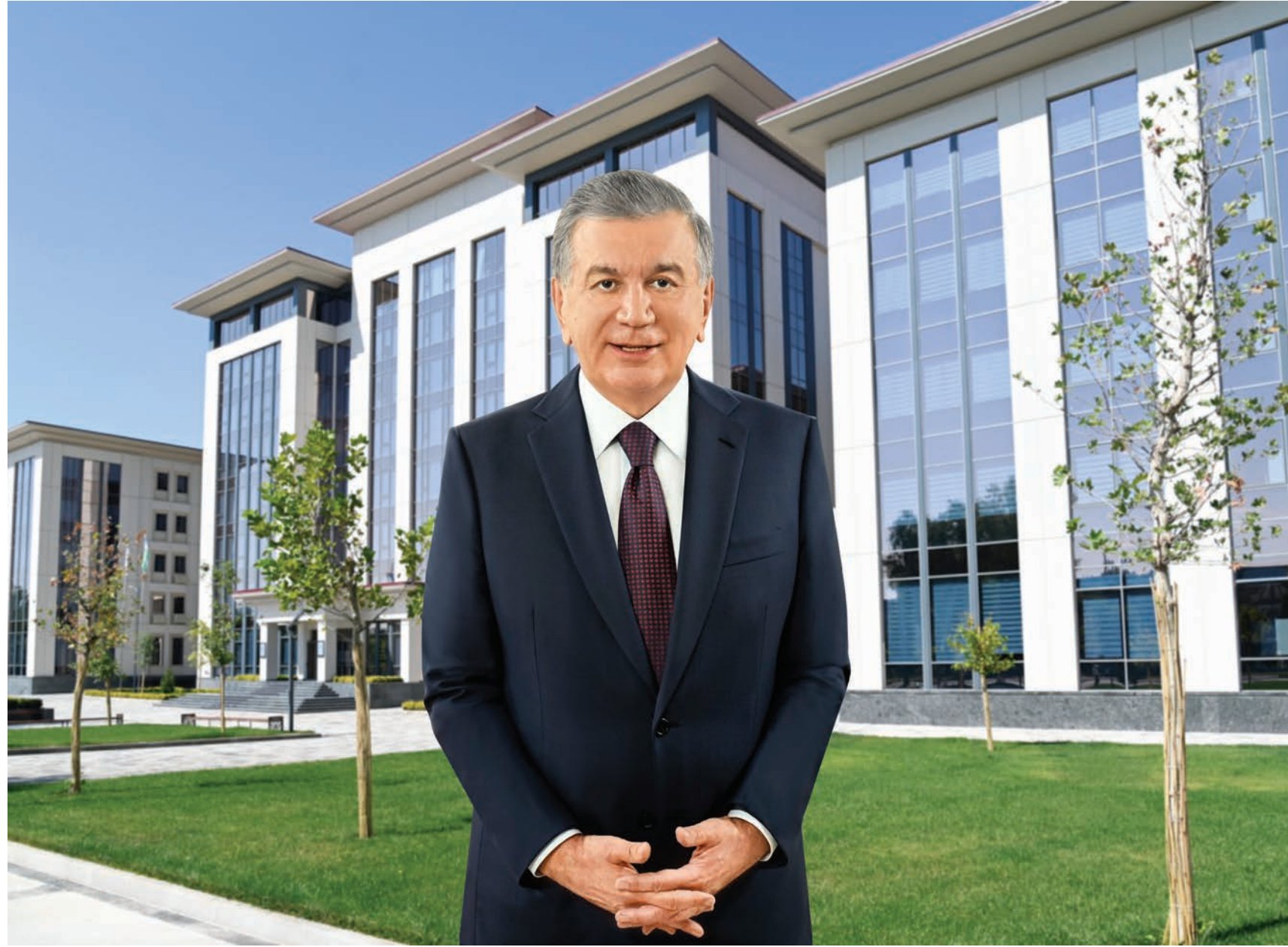
Президент Шавкат Мирзиёев 10 августа ознакомился с проводимой в городе Ташкенте созидательной работой.

Столица при сохранении своей исторической красоты обновляется, развивается на основе дальновидного плана и приобретает современный облик. Строятся величественные сооружения, учреждения науки, жилые дома, социальные объекты, дороги и мосты, создаются парки и скверы. Сначала глава государства посетил новое здание Ташкентского архитектурно-строительного института. Президент во время посещения вуза в октябре 2020 года поручил создать на его базе строительный кластер. Проект реконструкции института был расширен и доработан. В первую очередь для архитектурно-строительного института были построены два 5-этажных учебных корпуса, 8-этажный административный корпус. Здесь разместились научно-исследовательский центр строительных материалов, лаборатории, спортивный комплекс, общежитие.