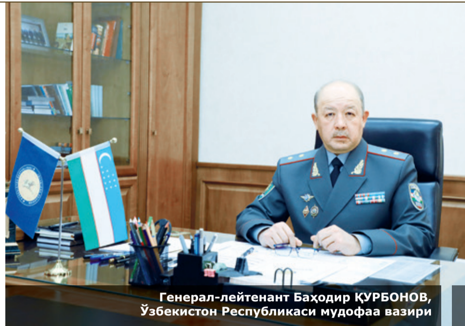
Генерал-лейтенант Баҳодир ҚУРБОНОВ, Ўзбекистон Республикаси мудофаа вазири

Қуролли Кучлар Олий Бош Қўмондонни ташаббуси билан Ўзбекистон Республикаси Қуролли Кучлари академияси янги халқаро стандартларга мос тако-