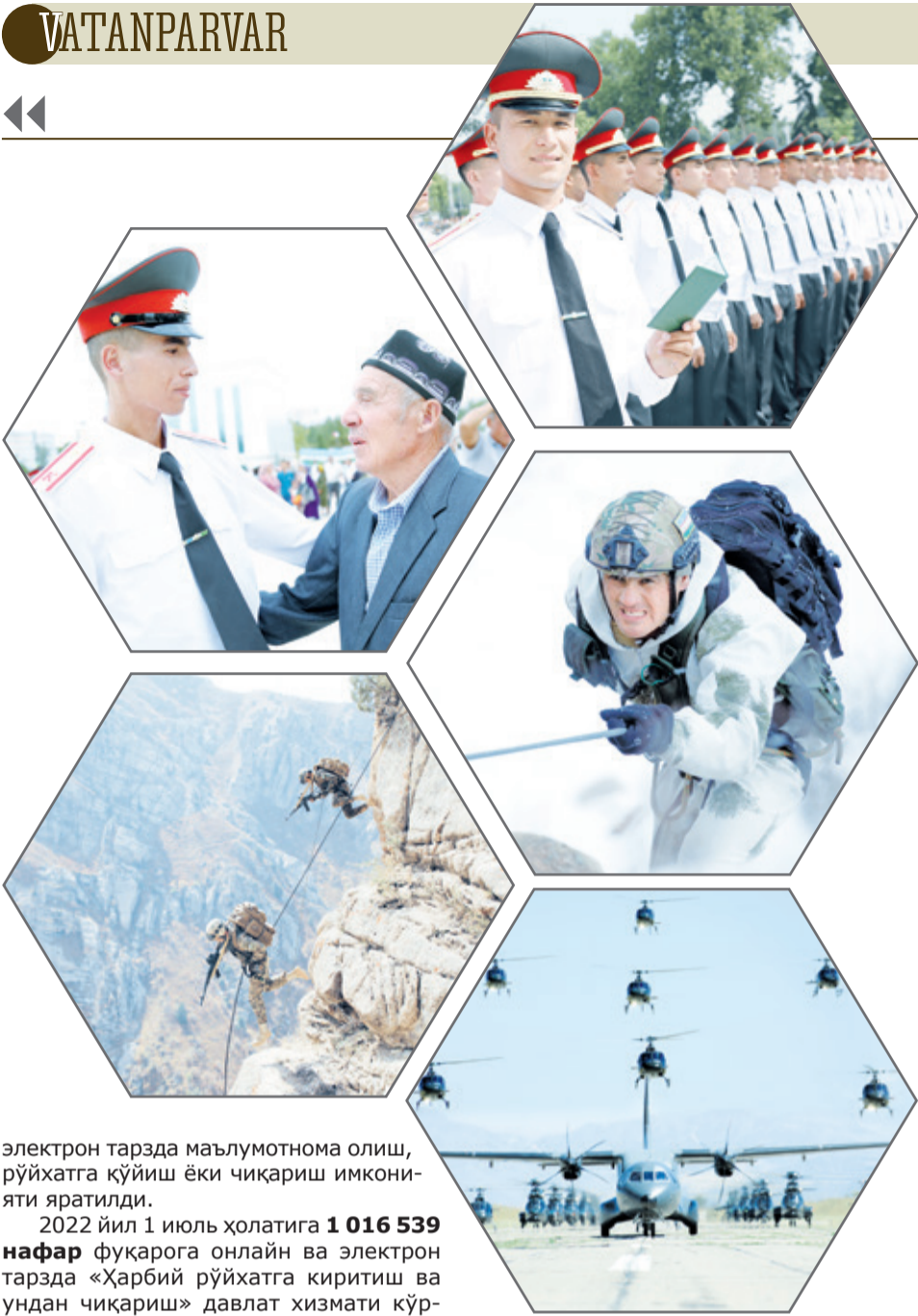
электрон тарзда маълумотнома олиш, рўйхатга қўйиш ёки чиқариш имкони яратилди.

2022 йил 1 июль ҳолатига 1 016 539 нафар фуқарога онлайн ва электрон тарзда «Ҳарбий рўйхатга киритиш ва ундан чиқариш» давлат хизмати кўрсатилди.