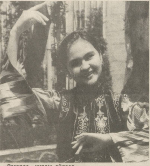
Раққоса хиром айласа...

рик ширкатлар фаолияти билан танишганман. У ёрнинг ойнадек теп-текис, раво йўлларида юриб, ўз юртимнинг камоллини ораш қилганман.