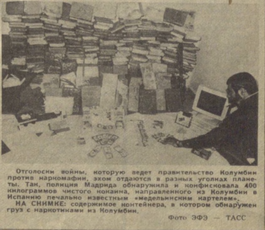
Отголоски войны, которую ведет правительство Колумбии против наркомании, эхом отдаются в разных уголках планеты. Там, полиция Мадрида обнаружила и конфисковала 400 килограммов чистого кокаина, выращенного в Колумбии в Испании легальным известным «медельинским нартелем». НА СНИМКЕ: содержимое контейнера, в котором обнаружен груз с наркотиками из Колумбии.