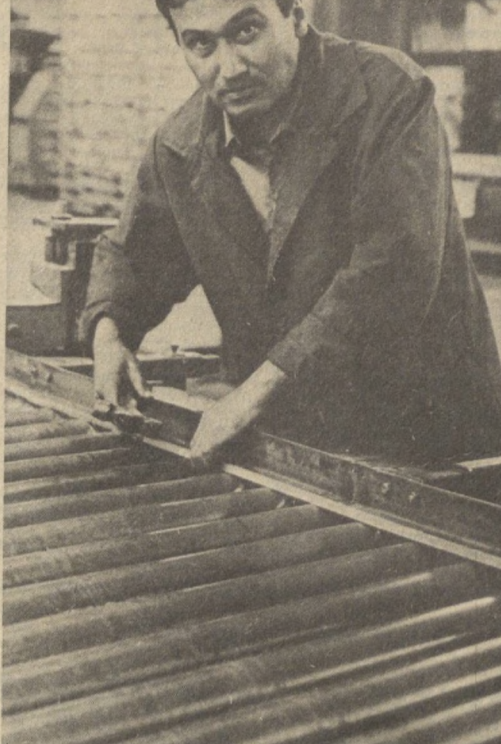
Более 20 видов продукции, а также товары широкого потребления выпускает таджикское производственное объединение «Сергел».

рудничество с целью добиться сокращения потерь сельскохозяйственной продукции при транспортировке, хранении, переработке и реализации.