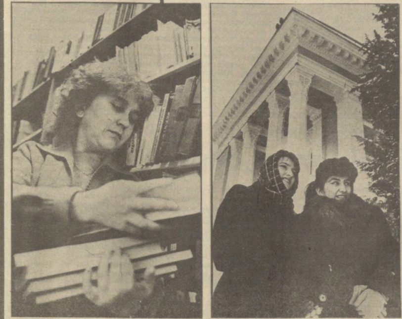
Почти полвека были недоступны для читателей библиотеки имени Алишера Навои отдельные произведения Рилея, Пушкина, Некрасова. Какую крамолу нашла сталинская цензура в бессмертных творениях великих русских художников? Об этом можно только догадываться. Так же, как и гадать, за что были «репрессированы» некоторые из статей Маркса, Энгельса, Ленина, долгие годы «отбывавшие срок» в подвалах спецхрана библиотеки.

Почти полвека были недоступны для читателей библиотеки имени Алишера Навои отдельные произведения Рилея, Пушкина, Некрасова. Какую крамолу нашла сталинская цензура в бессмертных творениях великих русских художников? Об этом можно только догадываться.