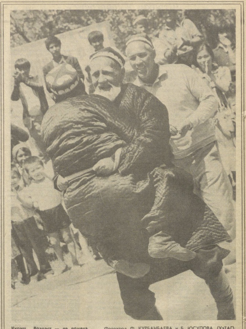
Кураш. Возраст — не помеха.

М. ТАТАРНИКОВ. Сотрудник УГАИ МВД УзССР.