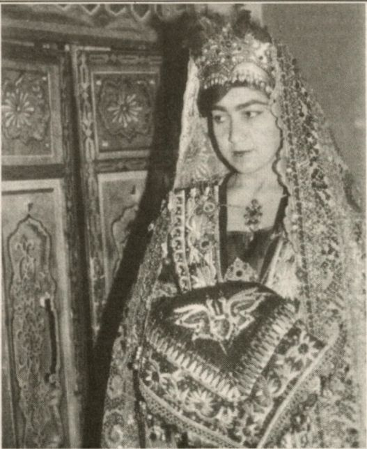
ТОЛЕИНГ ОЙДИН БЎЛСИН, КЕЛИНЧАК!