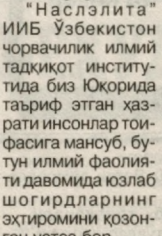
“Насрлати” ИИБ Ўзбекистон чорвачилик илмий тадқиқот институтида биз Юкорида таъриф этган ҳазратини инсонлар тоифасига мансуб, бутун илмий фаолиятини давомидида қозоғи шогирдларнинг эҳтиромини қозонган устоз бор.

Ҳаётда шундай инсонлар борки, шижоат, матонат ва иродани маслак тутиб, комиллик сари интиладилар. Комилликка элтидиган йўл эса илм машаққатларидан иборат. Айниқса, бутун умрини илм-фан учун бахшида этиб, унинг паст-баландликларини энгиб яшаган инсондан ҳар қачон ибрат олсақ, арзийди. Не ажабки, бу тоифа инсонлар ўта камтаринлиги, фидойиллиги билан гурур отига минмайдилар. Шунинг учунми, ич-ичимиздан уларга ҳавас қиламиз, ҳурмат ҳисси билан устоз, дея улуглаймиз.