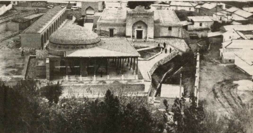
Нурота шаҳрига бежизга ана шундай шоирона таъриф беришмайди. Чунки бу ердаги ноёб чашма сувидан одамлар минг йиллардан бунён фойдаланиб келишади. Бу ердаги «Чашма» тарихий мажмуи мустақиллик йилларида қайта таъмирланиб, гавжум зияратгоҳлардан бирига айланди. СУРАТДА: мажмуанинг умумий кўриниши.