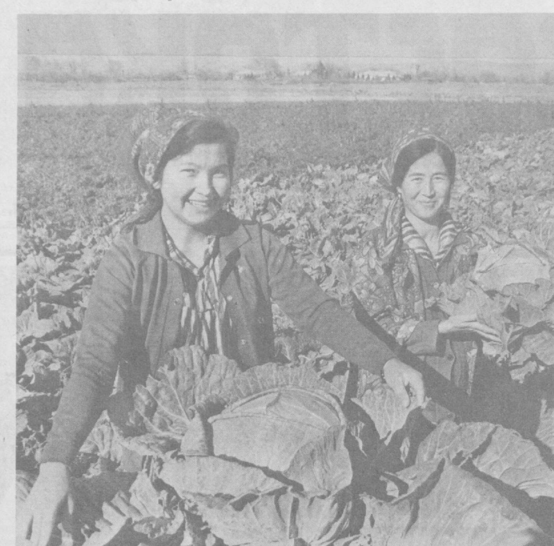
СУРХАНДАРЬИНСКАЯ ОБЛАСТЬ. Впервые за много лет добились рентабельности в овощеводстве рабочие совхоза «Ангор» Ангорского района. В минувшем году чистая прибыль от этой отрасли составила 372 тысячи рублей.