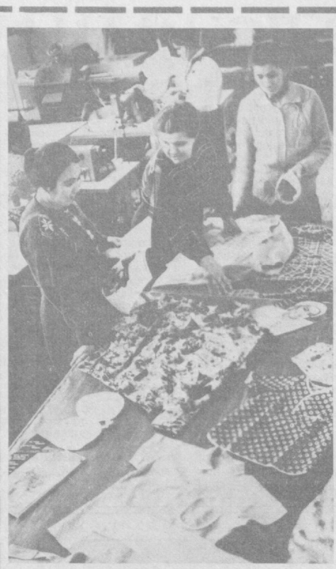
План поставок в прошлом году Каршинское производственно-швейное объединение имени 50-летия СССР выполнило на сто процентов, на 168 процентов произведено товаров народного потребления.

Открытие уголовной статистики была посвящена пресс-конференция, состоявшаяся 14 февраля в Министерстве внутренних дел СССР. — Рассекречивание данных о состоянии преступности вызвано теми необратимыми процессами демократизации и гласности, которые происходят сейчас в стране, — отметил начальник Главного информационного центра МВД СССР генерал-майор внутренней службы А. Смирнов.