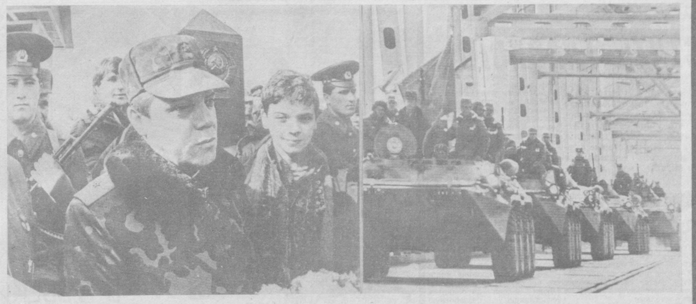
НА СНИМКАХ: генерала Б. В. Громова встречает сын; последняя воинская часть выведена из Афганистана.