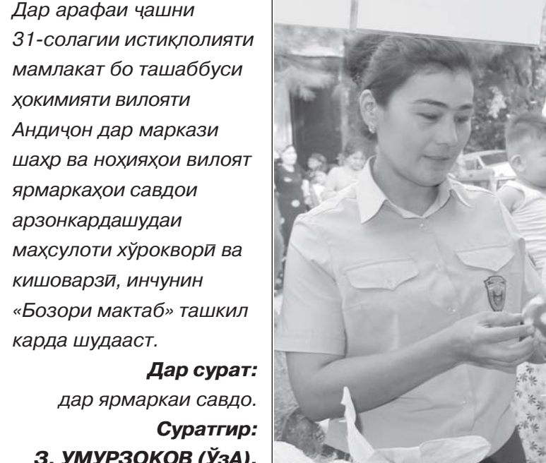
Дар арафаи қашни 31-солагии истиқлолияти мамлакат бо ташаббуси ҳоқимияти вилояти Андиҷон дар маркази шаҳр ва ноҳияҳои вилоят ярмарқаҳои савдои арзонкаҳшудаи маҳсулоти хӯроқворӣ ва кишоварзӣ, инчунин «Бозори мактаб» ташкил карда шудааст.

Дар сурат: дар ярмаркаи савдо.