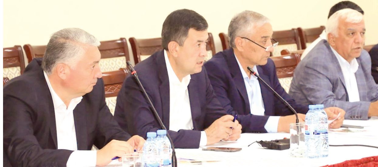
(Давоми. Бошланиши 1-саҳифада).

юрт тараққиёти, жамият фаровонлигини белгилайди