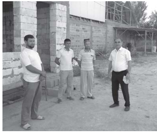
водителями соответствующих ведомств решил вопросы, поднятые в обращениях, поступивших в Сенат.