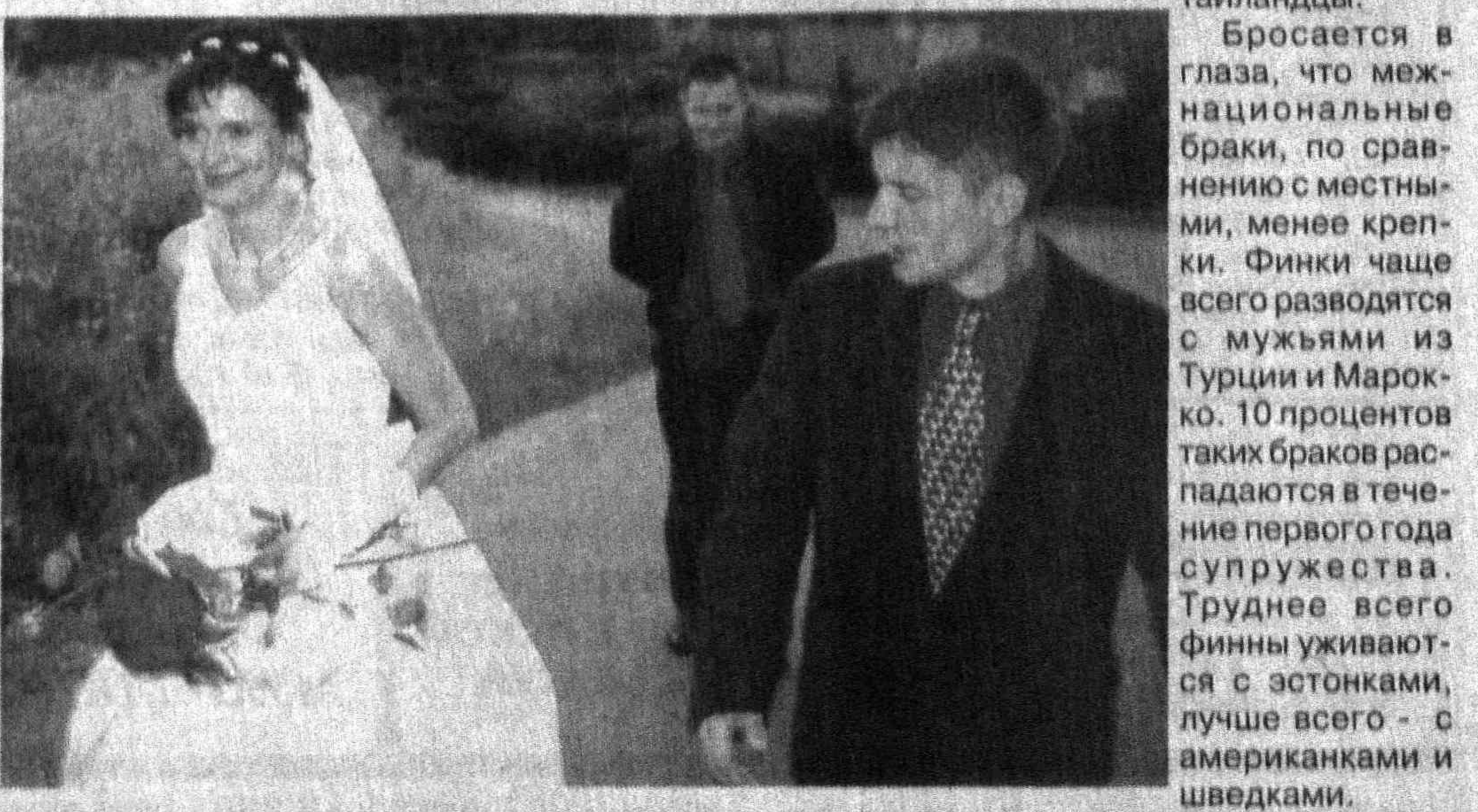
(По материалам средств массовой информации).

иностранцами - 12600 мужчин и 15400 женщин. Финские мужчины охотнее всего находят себе супругу в России или Эстонии. Финские женщины также предпочитают русских мужчин, которым, правда, на пятки наступают американцы и шведы. За безусловными лидерами следуют представители 12 народов, к которым финны ездят в гости на отдых: турки, марокканцы и тайландцы.