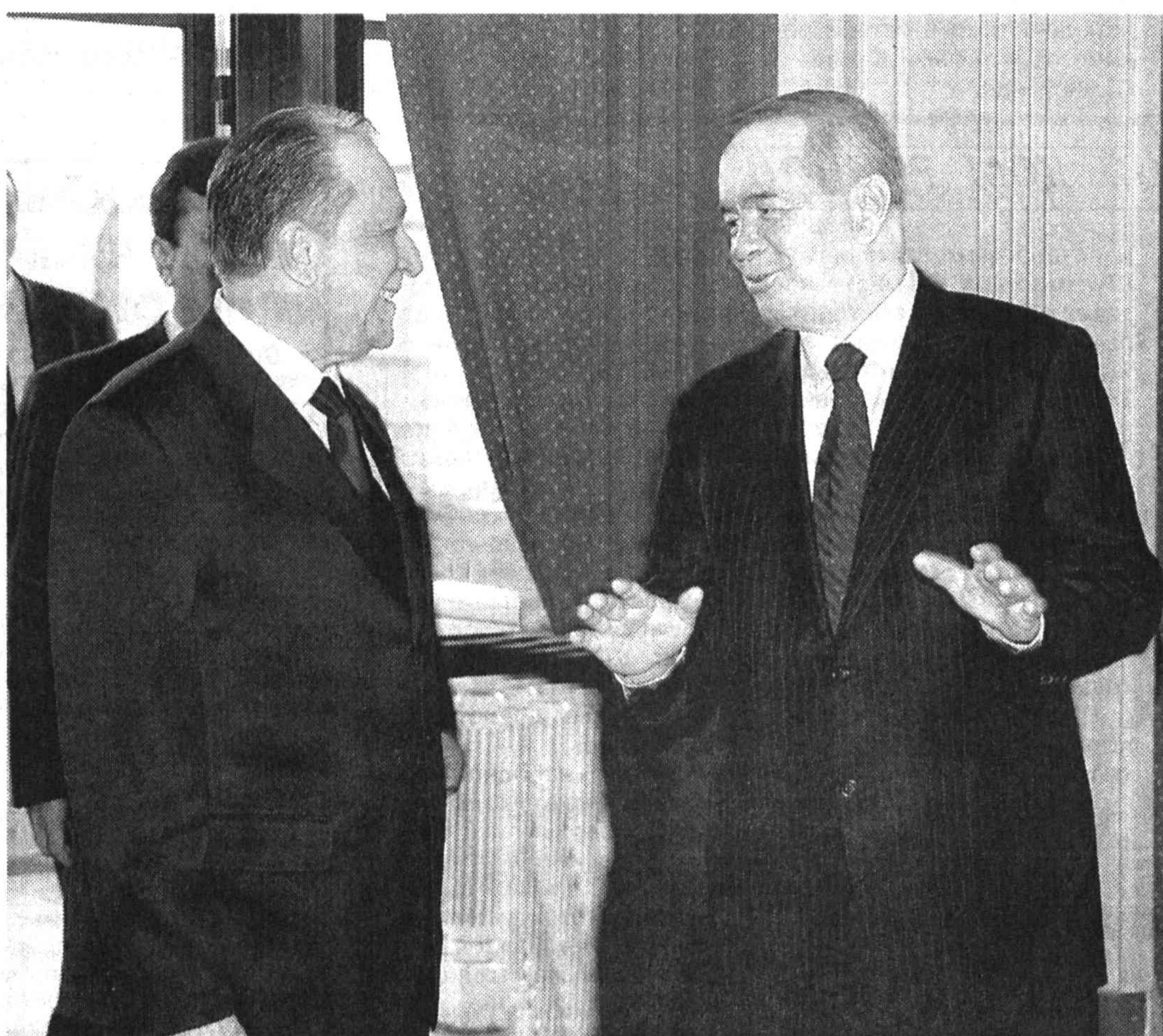
21 апреля в Узбекистан с официальным визитом прибыл Президент Румынии Ион Илиеску. В Ташкентском аэропорту высокого гостя встречали премьер-министр Республики Узбекистан Уткир Султанов и другие официальные лица.

22 апреля в резиденции «Дурмень», после церемонии официальной встречи, состоялась беседа с глазу на глаз Президента Узбекистана Ислама Каримова с руководителем Румынии. В ходе беседы обсуждались нынешнее состояние и перспективы отношений между двумя нашими странами, международные проблемы и другие вопросы, представляющие взаимный интерес. Обмениваясь мнениями о дальней-