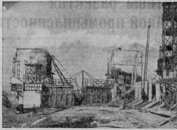
«Волгодонстрой». На строительстве 10-го шлюза.

Высокопроизводительно работает предприятие в новом году. Январское задание выполнено на 108,5 процента. В феврале ежегодно вырабатывается сверх плана несколько тысяч пудов рафинада. На заводе нет ни одного рабочего, не выполняющего норм. Коллектив предприятия обязался годовой план выполнить к 21 декабря.