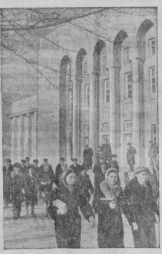
Кара-Калпакская АССР. Здание Кара-Калпакского государственного объединенного педагогического и учительского института в городе Нукусе.