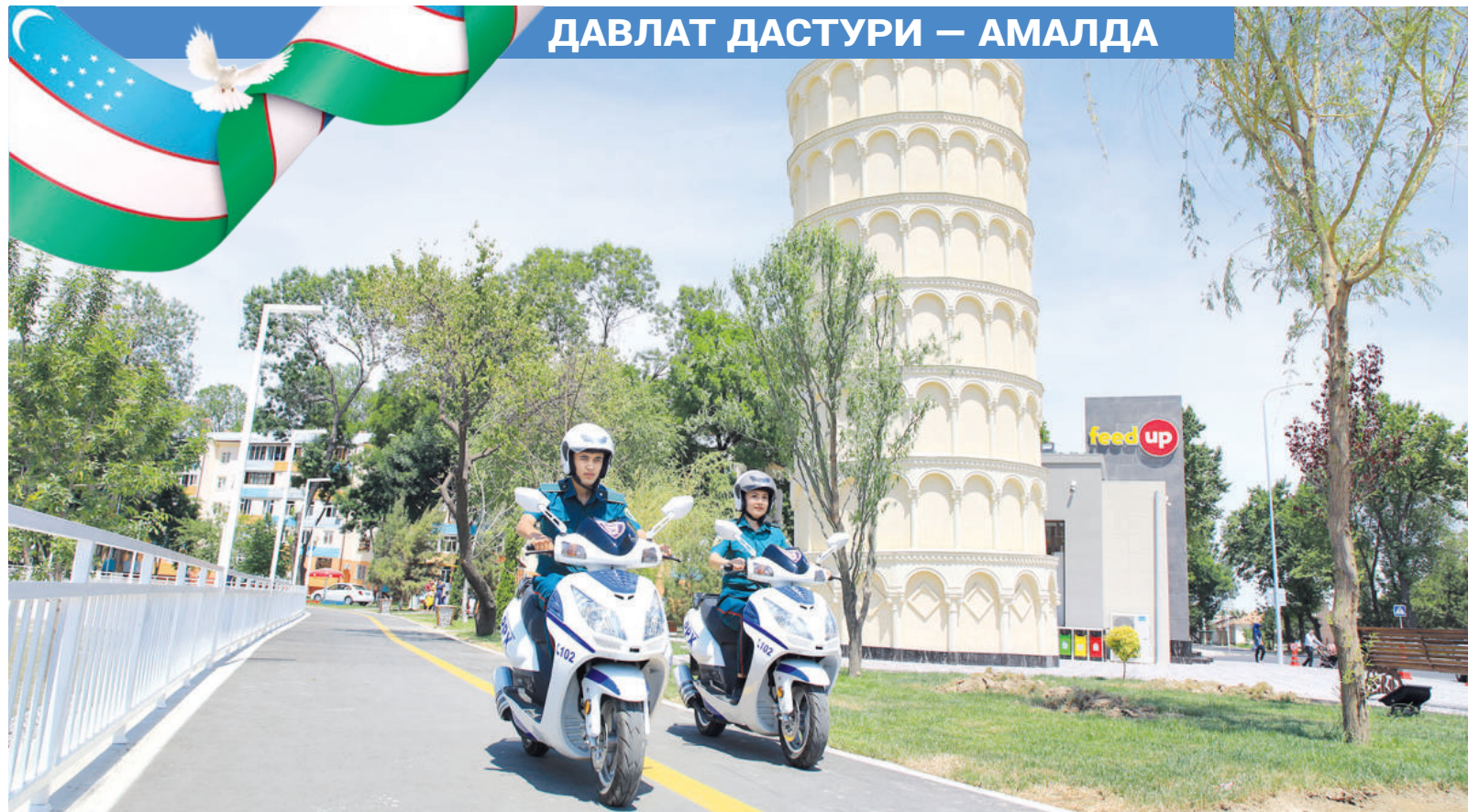
ДАВЛАТ ДАСТУРИ — АМАЛДА