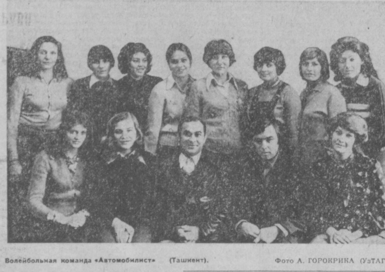
Волейбольная команда «Автомобилист» (Ташкент).