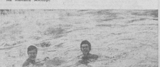
В ледяной купели.