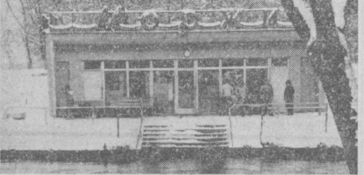
«Резиденция» ташкентских любителей зимнего плавания на канале Анхор.