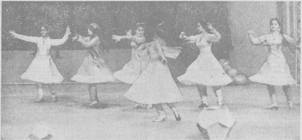
Выступают танцовщицы ансамбля «Шодлин».