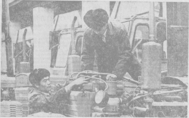
Подхватив инициативу ферганских механизаторов и ремонтников, труженники колхоза имени Ленина Бухаринского района решили завершить ремонт всей сельхозмашиностроительной техники...