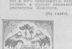
Рис. Ю. БРОДИЦКОГО.