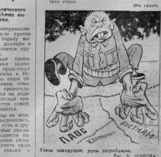
Глаза завидующие, руки згребущие. Рис. Б. ЖУКОВА.