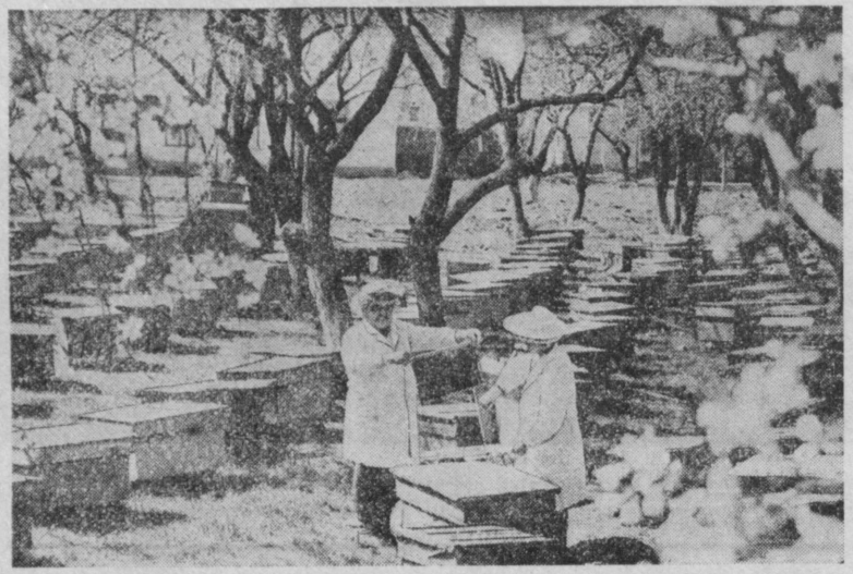
Два года назад в Андиканском районе создан специализированный пчеловодческий совхоз. В хозяйстве насчитывается 2.340 пчелиных семей. В нынешнем году пчеловоды решили получить 50 тонн меда — на 13 тонн больше, чем в минувшем году. На снимке: на одной из соковых пасек.

КАСАИ. (Соб. корр.). Четыре года назад правление Масанского райпотребсоюза организовало откормочный пункт. У населения закупали и поставили на доращивание и откорм около шестистот голов крупного рогатого скота.