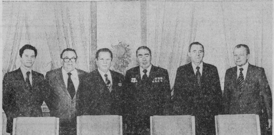
Перед началом переговоров.

По приглашению Президиума ЦК КПЧ и правительства ЧССР в ближайшие дни Чехословацкую Социалистическую Республику с дружественным визитом посетит член Политбюро ЦК КПСС, Председатель Совета Министров СССР А. Н. Косыгин.