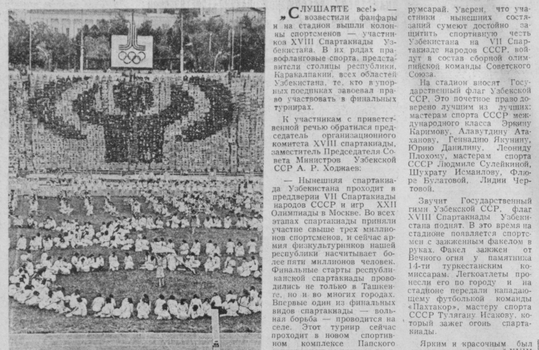
На снимке: торжественное открытие XVIII Спартакиады Узбекистана.

Вчера на стадионе Центрального Республиканского комбината «Пахтакор» состоялось торжественное открытие XVIII спартакиады Узбекистана