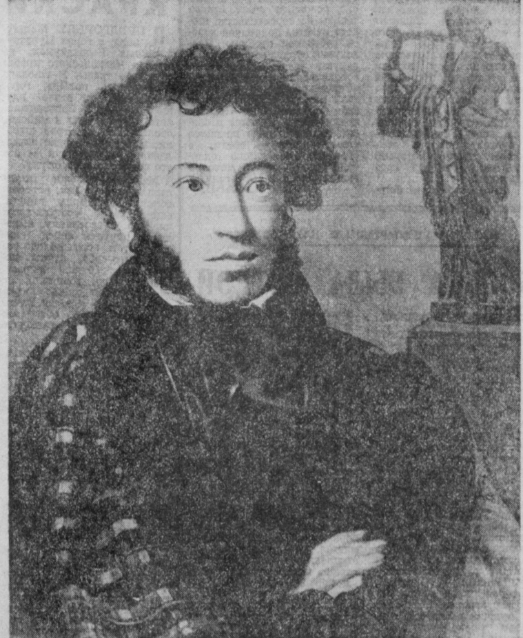
А. С. Пушкин. (Репродукция с картины художника О. Кипренского).