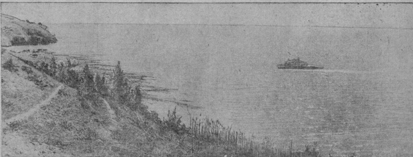
Несколько месяцев назад здесь были лес, степь. Теперь эта земля оказалась дном Цимлянского моря. На снимке: Цимлянское море в районе рабочего поселка Цимлянский.