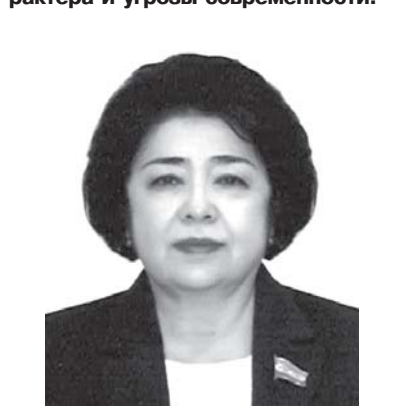
Гулнора МАРУФОВА, сенатор, работающая на постоянной основе в Комитете Сената Олий Мажлиса по вопросам женщин и гендерного равенства.

В концептуальной статье, посвященной предстоящему саммиту ШОС, глава государства охарактеризовал актуальные вызовы глобального характера и угрозы современности.