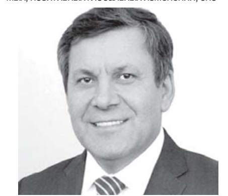
Януш Пехочинский, президент Торгово-промышленной палаты «Польша — Азия», бывший заместитель Премьер-министра и министр экономики Польши.

«Саммит Шанхайской организации сотрудничества в Самарканде под председательством Узбекистана будет проходить в очень сложное время. С одной стороны, в условиях противостояния старой и зарождающейся геополитической, а значит, и геэкономической системы, идет переформатирование места и роли ведущих держав в мировом развитии. С другой стороны, мир устал от пандемических ограничений и в течение трех лет ожидает каких-либо значимых, позитивных глобальных изменений, способных восстановить доверие стран друг к другу и не дать разрушиться устоявшейся системе международного права.