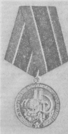
Вчера в «Правде Востока» был опубликован Указ Президиума Верховного Совета СССР об учреждении медали «За освоение юга и развития нефтегазового комплекса Западной Сибири», а также положение о новой медали и ее описании. Из sinistra: так выглядит новая медаль.