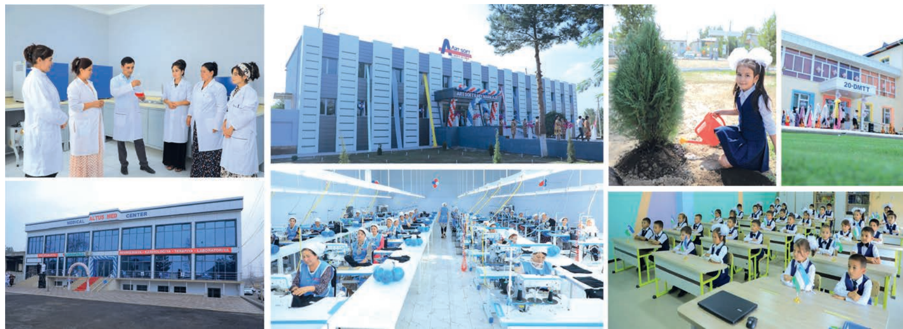
«Окончание. Начало на 1-й стр.»

В рамках принимаемых широкомасштабных мер по обустройству регионов повсеместно возводятся жилые массивы повышенной комфортности, строительными темпами развиваются дорожно-строительная и транспортно-коммуникационная отрасли, создаются крупные индустриальные комплексы, оснащенные новейшими технологиями.