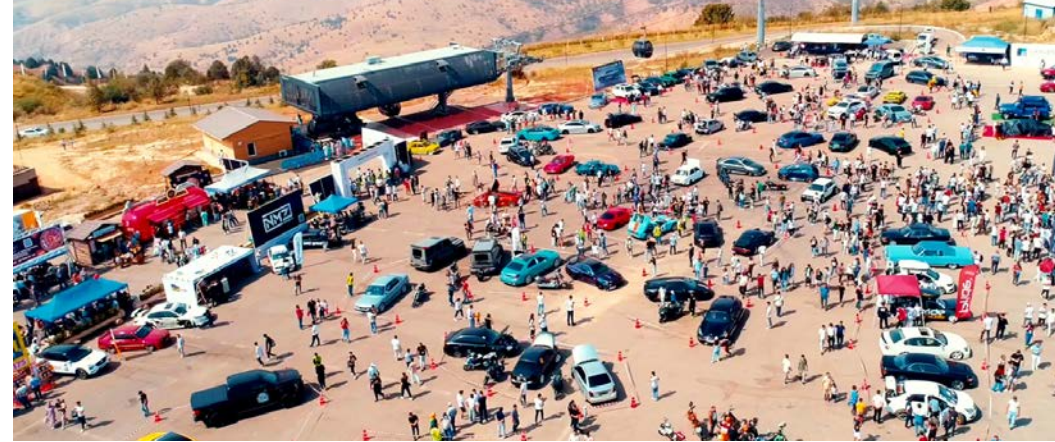
Недавно в Бостанлыкском районе Ташкентской области на территории всепогодного курорта Amirsoy Resort состоялся красочный фестиваль Motor Fest 2022, собравший на одной площадке людей, увлеченных автоспортом, тюнингом машин, реставрацией и коллекционированием ретроавтомобилей.