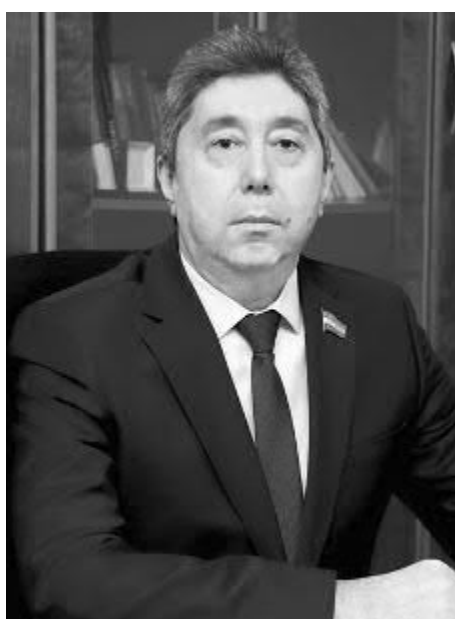
Улуғбек ВАФАЕВ, Олий Мажлис Қонунчилик палатаси депутаты, ЎзХДП фракцияси аъзоси:

— Шанхай ҳамкорлик ташкилотига аъзо давлатлар жойлашган минтақа буюк иқтисодий ҳамда маънавий-маданий бойлик маконидир. Мазкур макон минг йиллар мобайнида бутун дунёнинг иқтисодий ривожланишига таъсир кўрсатган ҳамда илмий, фалсафий, маънавий ва маданий тараққиёти учун илҳом берган.