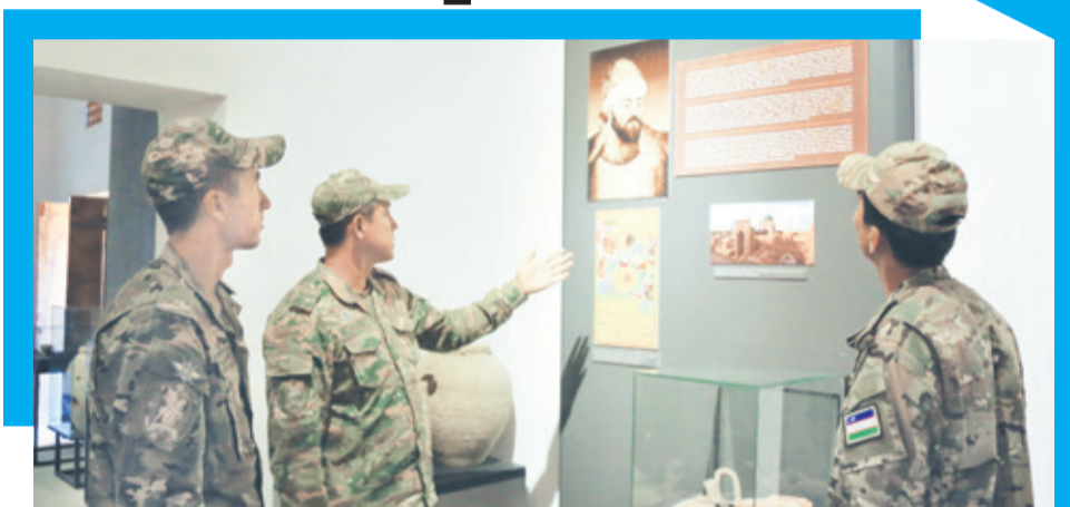
Шимоли-ғарбий ҳарбий округ матбуот хизмати

Шундан сўнг ҳарбий хизматчилар Урганчда очилган Жалолиддин Мангуберди ёдгорлик мажмуасига саёҳат қилишди.